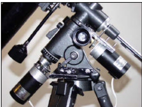
Fig. 1a. IRC tournant

Programme susmentionné réponds au schéma et aux placements d'IRC et d'IRC-M sur la monture de télescope d'après deux photographies qui suivent: